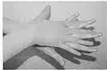
2. 手の甲を伸ばすように洗う