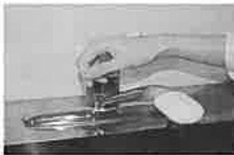
7. 水道の栓を止めるときは、手首が肘で止める。できないときは、ペーパータオルを使用して止める