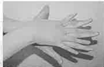
2. 手の甲を伸ばすように洗う