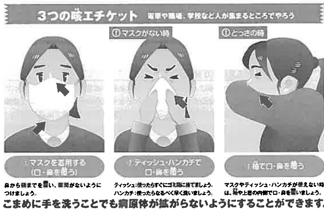
図3 咳エチケットについて