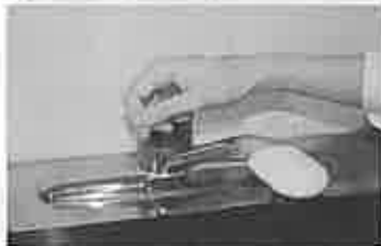
7. 水道の栓を止めるときは、手首が肘で止める。できないときは、ペーパータオルを使用して止める