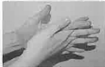
4. 指の間を十分に洗う