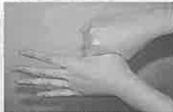
5. 親指と手掌をねじり洗いする