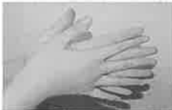
1. 手のひらを含ませ、よく洗う