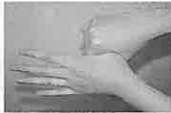
5. 親指と手掌をねじり洗いする